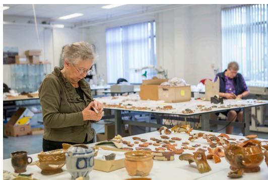
Vrijwilligers reconstrueren opgegraven objecten op de archeologische dienst van Delft.

Daarnaast is de reikwijdte van archeologie enorm, want het bestuderen van samenlevingen is behoorlijk veelomvattend: van economie tot gezondheid, van religie tot technologie. Tenslotte is de verschijningsvorm van archeologie ook erg divers: van grondsporen en grondlagen tot allerlei materialencategorieën zoals aardewerk, glas, hout, bot, metaal enzovoorts, wat allemaal weer aparte specialisaties zijn. Het moge duidelijk zijn dat archeologen gebaat zijn bij focus en daarbij een goede puzzel niet uit de weg gaan.