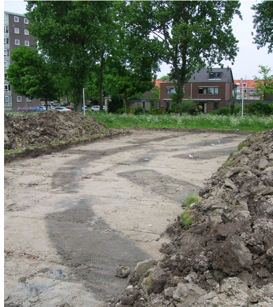
Een voorbeeld van grondsporen tijdens een opgraving aan de oostzijde van Delft. De bruine vlekken zijn kuilen en greppels van bewoning uit de 12e eeuw.

kunt de mens eigenlijk niet los zien van het landschap waarin hij leeft.