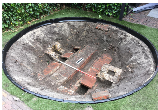
Archeologie zit dicht onder het oppervlak in heel de Delftse binnenstad en daaromheen. Bij het graven van een gat in de achtertuin voor een trampoline kwamen deze 400 jaar oude goten en muren tevoorschijn.

In de binnenstad, op een klein oppervlak, hebben bijna 1000 jaar lang continu en intensief mensen geleefd. Die hebben letterlijk hun sporen nagelaten in de bodem. Een stad als Delft staat nooit stil en blijft zich ontwikkelen. Daarbij is het onvermijdelijk dat bodemresten verdwijnen. Delft wil echter voorkomen dat dit ongezien gebeurt, want daarmee verliest ze haar verleden. De informatie die in de bodem besloten ligt is namelijk uniek: eenmaal weg is voor altijd weg. Tijdens het doen van een opgraving worden deze resten eigenlijk ook vernietigd, maar wel heel nauwkeurig vastgelegd. Op die manier blijft de informatie beschikbaar voor toekomstige generaties.